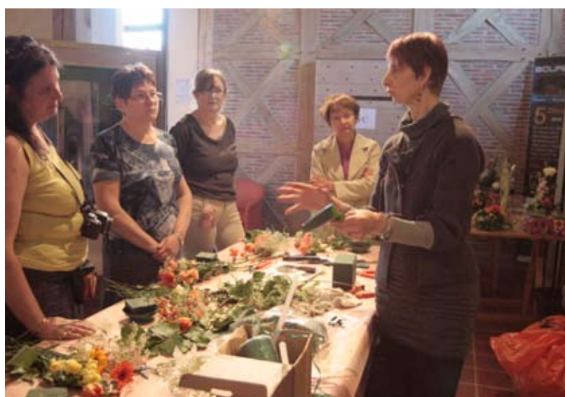
Atelier composition florale