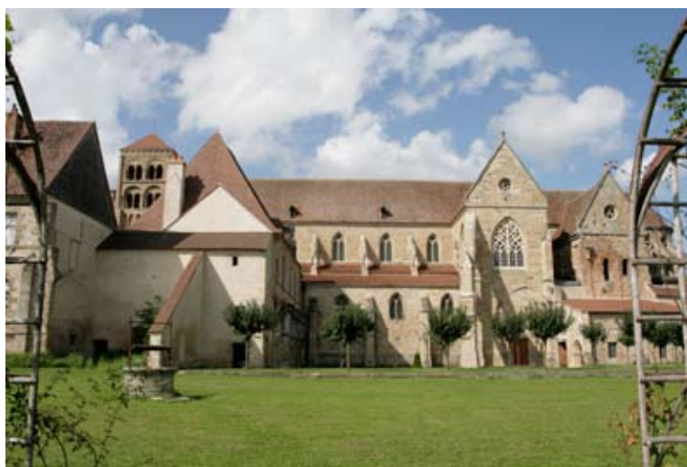
La partie haute du jardin où se tient le Salon des plantes

L'espace est attenant au côté sud de l'église prieurale et aux bâtiments monastiques.