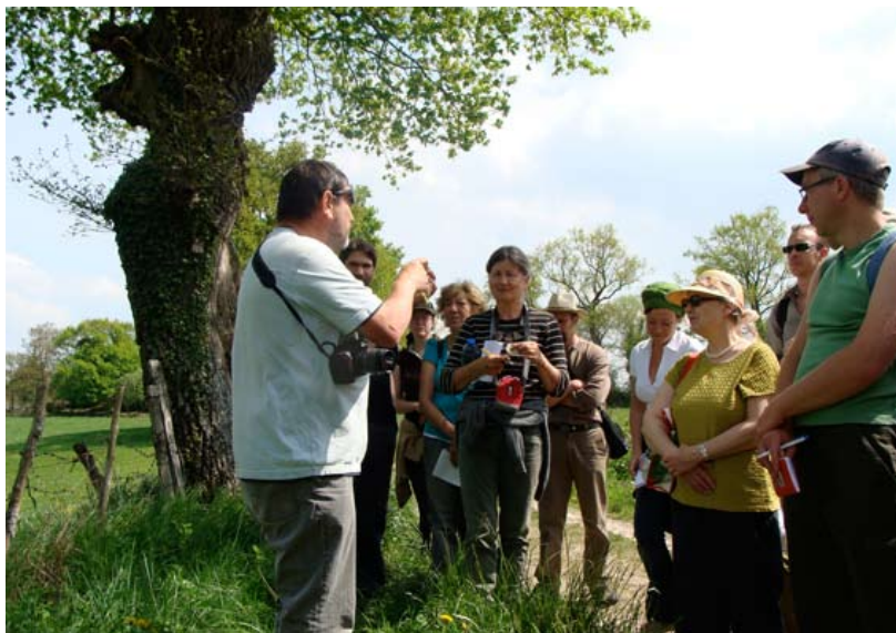
Sortie botanique le dimanche après-midi