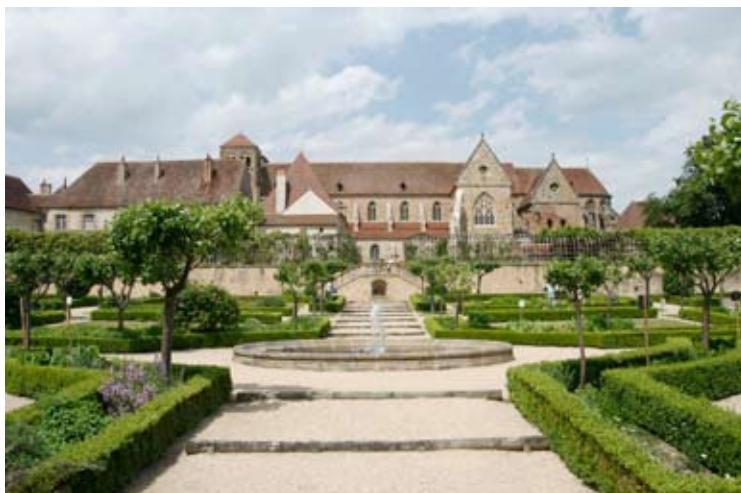
Vue d'ensemble de la partie basse du jardin

Le jardin se compose de deux parties : une partie basse entretenue par le jardinier de la commune qui se visite en même temps que le musée de la ville et une partie haute, utilisée par les frères de la communauté de Saint Jean vivant au monastère.