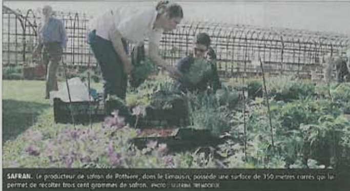
SAFRAN. Le producteur de safran de Robine, dans le Limousin, possède une surface de 350 mètres carrés qui le permet de récolter trois cent grammes de safran.

► Protique. Dimanche, de 10 à 18 heures, 2 € l'entrée pour l'ensemble du site et des conférences.