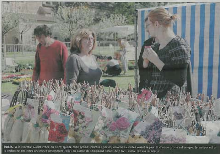
ROSES. A la roserie Guillot créée en 1829, quinze mille graines plantées par an, environ six mille voient le jour et chaque graine est unique. Le visiteur est à la recherche des roses anciennes notamment celles du comte de Chambard datant de 1863.

Le producteur, cueilleur Oualis vend des plantes populaires, traditionnelles et médicinales. Pour des problèmes de digestion, on conseille des produits à base de romarin et les orties sont connues pour leurs propriétés reminéralisantes. Le phénomène de mode se constate également sur ce stand : « La