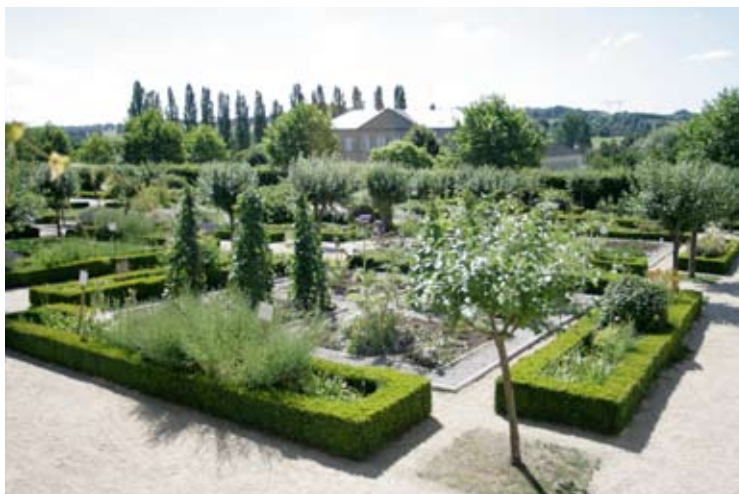
Le jardin de monastère dans la partie basse

Dans cet espace, tous les végétaux sont étiquetés ce qui permet aux visiteurs d'allier le plaisir de la promenade à la connaissance des plantes. Le public découvre alors les propriétés médicinales et les divers usages des végétaux du jardin.