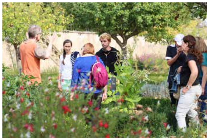
Visite sensorielle et Goûter Jardin

poires, confectionnées par des artisans locaux et accompagnées d'un vin aux fruits rouges, « Le Moretum », élaboré à partir de vin de Saint-Pourçain par Les Trois Druides, entreprise artisanale basée à Clermont-Ferrand.