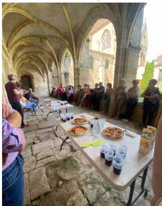
Goûter sous le cloître