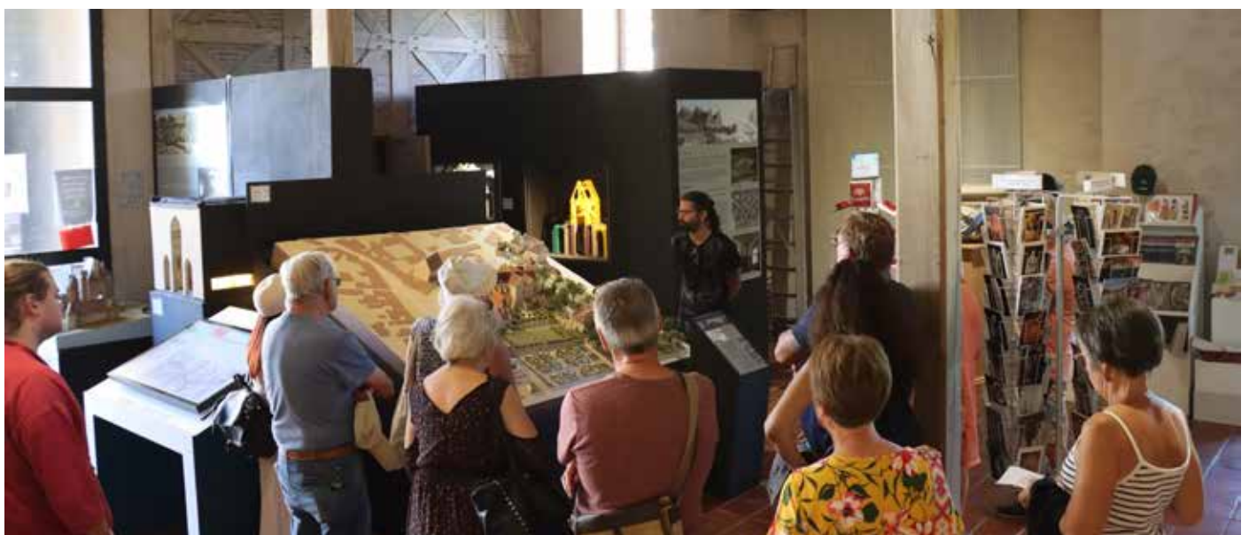
Grange Nord, accueil, départ des visites des musée et Jardin du Prieuré