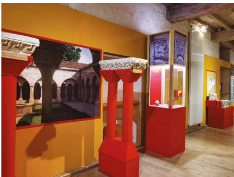
Exposition temporaire au musée de Souvigny

En 2024, le musée vous invite à découvrir l'exposition « Trésors d'un prieuré clunisien » dans le cadre de la candidature de Souvigny au Patrimoine Mondial de l'UNESCO.