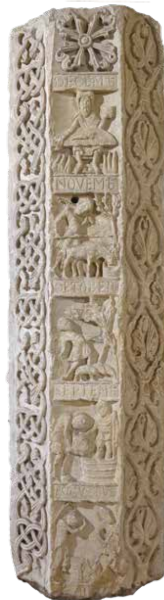
Colonne du Zodiaque

Dans un cadre d'exception, les jardins offrent un moment d'évasion aux visiteurs et permettent aux enfants de découvrir la biodiversité grâce aux ateliers pédagogiques proposés par le musée et une visite sensorielle dans le cadre de la visite du Goûter